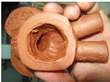
Imagen 20. Una de las partes ahuecada