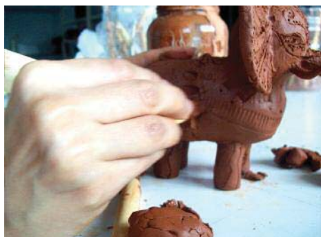
Imagen 28. Restaurando la superficie