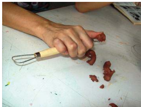
Imagen 19. Quitando el barro del interior