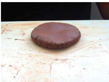
Imagen 9. Creación de una placa para cortar los triángulos que serán las orejas