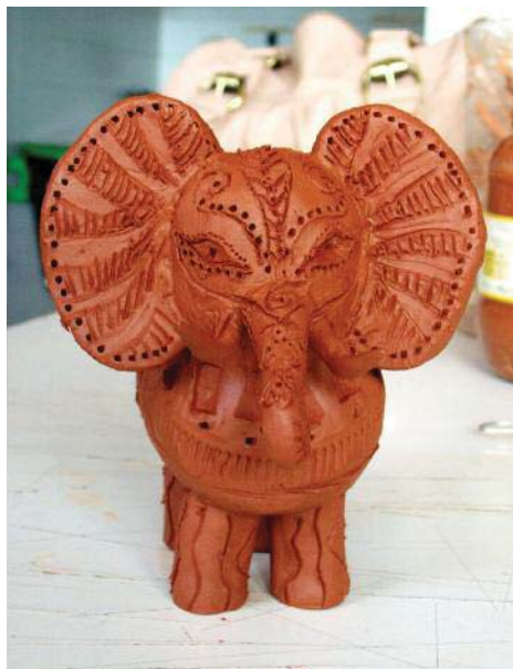
Imagen 13. Detalle del elefante