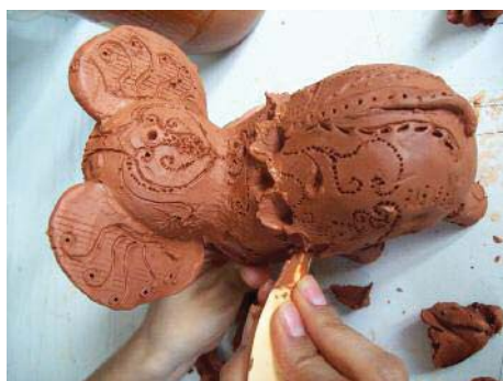
Imagen 27. Completando la sutura