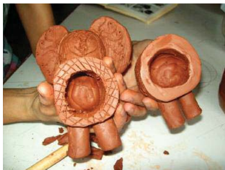
Imagen 21. Las dos partes ahuecadas y preparándolas para unir