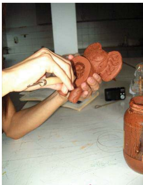
Imagen 18. Ahuecando