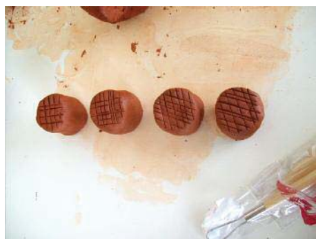
Imagen 6. Rayando las superficies a unir