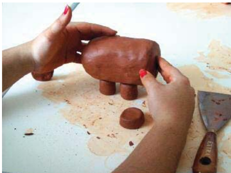
Imagen 5. “Presentando” las patas al cuerpo