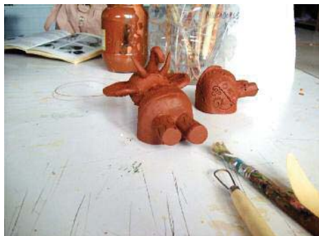
Imagen 17. La figura cortada