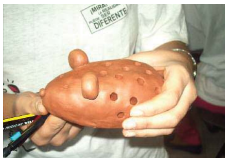
Imagen 32. Ahuecado por debajo, sencillo