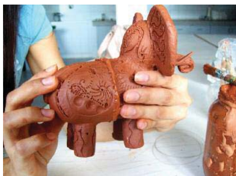
Imagen 26. Unimos ambas superficies presionando y quitamos el exceso de barbotina