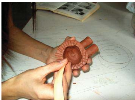
Imagen 22. Haciendo el rayado en las partes a unir