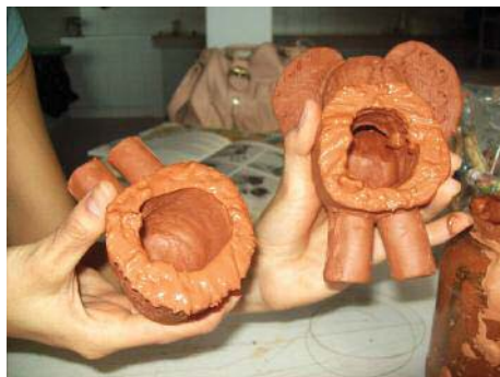
Imagen 25. Aplicando barbotina en ambas partes