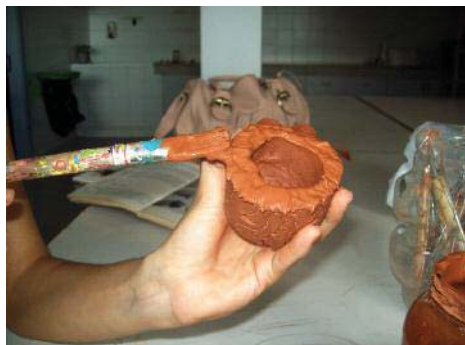
Imagen 24. Aplicando barbotina