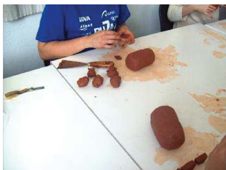
Imagen 3. Creando las partes