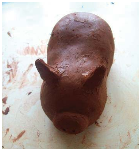
Imagen 10. Uno de los cerdos visto desde arriba