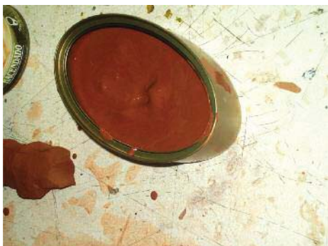
Imagen 7. Barbotina