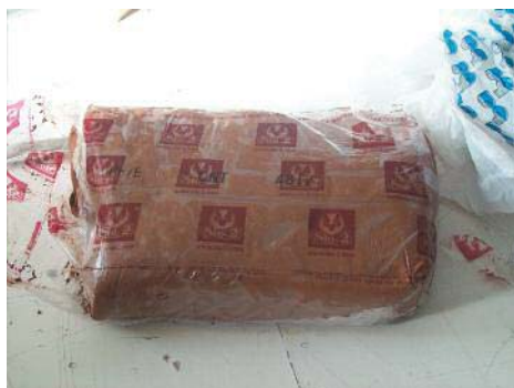
Imagen 1. Barro de baja temperatura de cocción