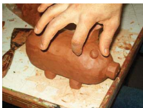
Imagen 8. Pegando los ojos