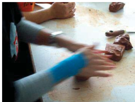
Imagen 2. Creando un cilindro