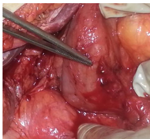
Figura 1 Perforación duodenal parcialmente cerrada con el sistema OVESCO con la pinza endoscópica atrapada.

Se decidió intervenir a la paciente de forma urgente, evidenciándose una perforación de aproximadamente 2 cm en pared posterior duodenal parcialmente ocluida con el OVESCO, con la pinza endoscópica atrapada en la oclusión y exteriorizada a través de la pared duodenal (fig. 1). Se realizó maniobra de Kocher amplia, duodenotomía para extracción del dispositivo (fig. 2) y cierre en monoplano de la perforación con epiploplastia. Se colocó yeyunostomía de alimentación. La paciente evolucionó favorablemente, reintroduciéndose la dieta oral con buena tolerancia, y siendo dada de alta 14.º día postoperatorio.