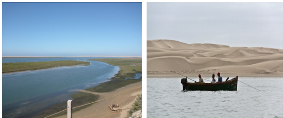
Figura 5. Paseo en barco en la laguna de Naila

En la actualidad la cooperativa de pescadores de Naila se compone de once barcos de pequeño tamaño, según Abdlmajid Ayach 4 , miembro de la cooperativa (ver figura 5)