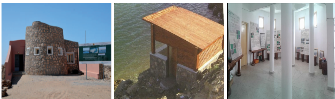
Figura 4. Centro de información (izq.), puesto de observación de aves (centro) y Ecomuseo (drcha.).

En el parque nacional Khenifiss, el principal actor comunitario que intervino fue la Red Asociación Khenifiss. Esta participó en el proyecto a través de un programa específico de pequeñas donaciones gestionado por la ONG SPANA, como socio internacional, junto con la Alta Comisaria y la Agencia de Desarrollo Social. El programa, con un coste total de 960.000 DH, se puso en marcha en 2005, con el objetivo final de convertir al parque en un destino eco-turístico y potenciar el uso racional de sus recursos naturales. Para ello, se creó un centro de información para visitantes y tres puestos para la observación de aves migratorias y se diseñaron varias rutas ecoturísticas (ver figura 4). En relación con esto último hay que advertir, que estas rutas no han dado los resultados que se esperaban, por la falta de información, señalización y la incorrecta promoción que se ha hecho.