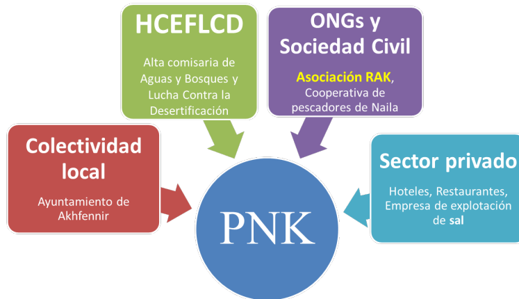
Figura 3. Agentes en la gestión del PNK