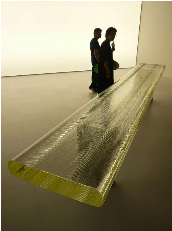
Banco "Water block" de Tokujin Yoshioka. Un ejemplo de diseño japonés reciente (2002-2004) que explora temas profundamente arraigados en la cultura (como, en este caso, la relación con la naturaleza), con medios contemporáneos.

Los consumidores y productores japoneses no deben pensar en el mobiliario como un artículo "desechable", sino como un patrimonio social que puede transmitirse de generación en generación.