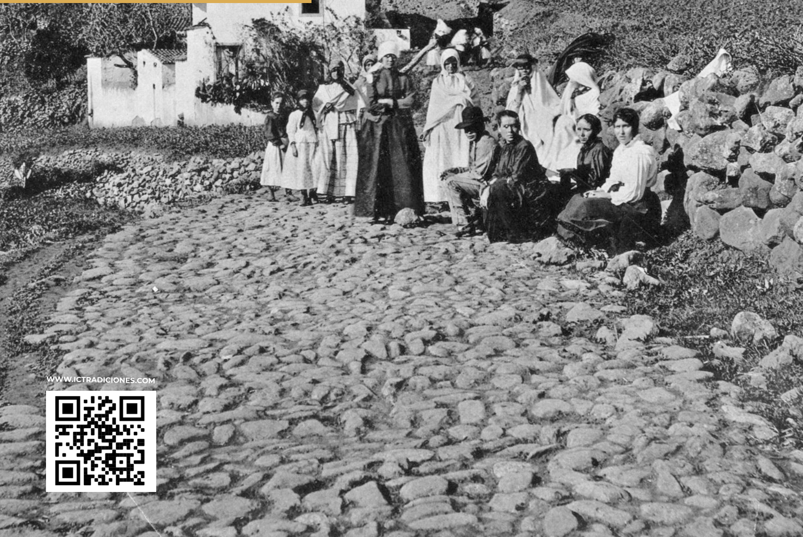
(1890). Campesinas sentadas en el camino.