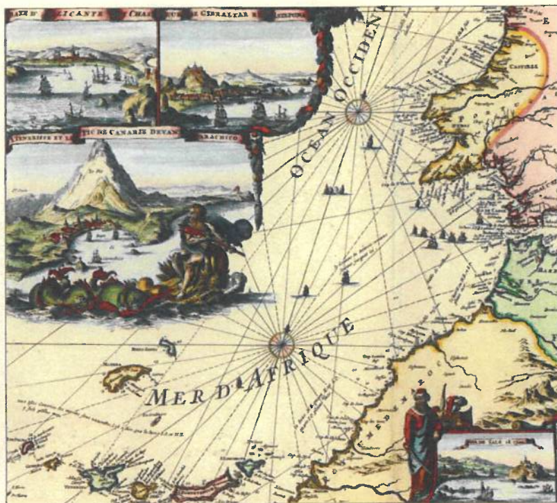
Romain de Hooghe, Carte Nouvelle de La Mer Mediterranee [detalle]. En Pierre Mortier, Atlas Maritimus... , 1693. The National Maritime Museum of Greenwich

La exposición, a partir de estos presupuestos, propone un amplio debate articulado por estudiosos, profesionales, científicos, artistas e intelectuales, en consonancia con una selección de documentos poseedores de un innegable valor referencial científico y artístico, que pueden contribuir a ofrecer a los ciudadanos esta imprescindible reflexión.