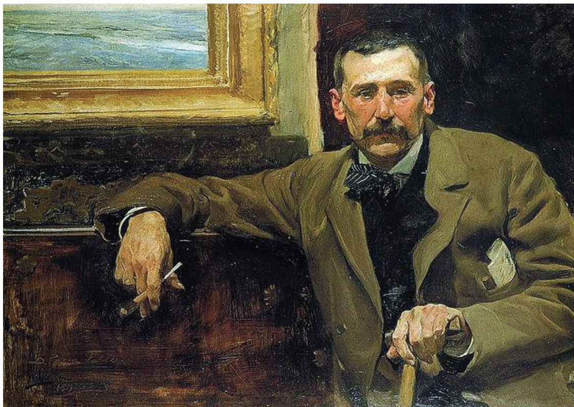
(Sorolla, J., 1894)