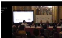
10/01/2019 Vídeo de la presentación de la XI BIAU