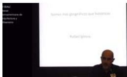
10/01/2019 Vídeo de la conferencia del arquitecto Javier Corvalán. XI