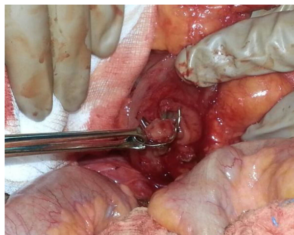
Figura 2 Sistema OVESCO cerrado una vez extraído, ocluyendo la pared intestinal y atrapando la pinza endoscópica.

de alimentación. La paciente evolucionó favorablemente, reintroduciéndose la dieta oral con buena tolerancia, y siendo dada de alta 14.º día postoperatorio.