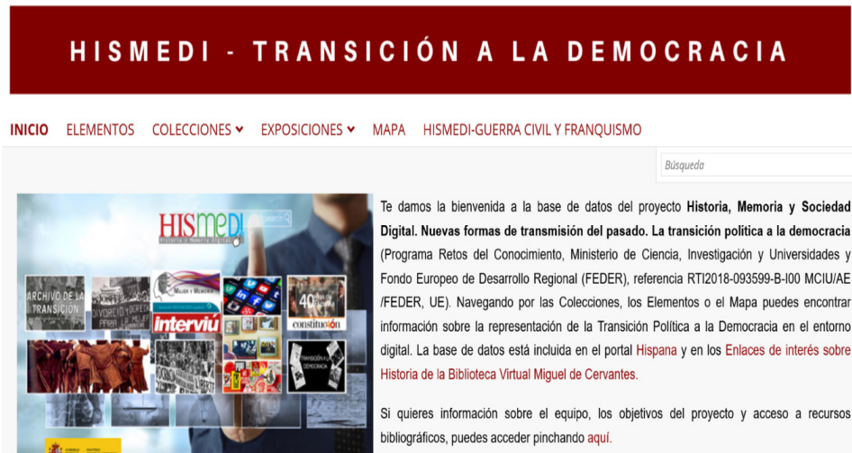
Figura 1. Proyecto HISMEDI-Transición a la Democracia.

Para su creación se elaboró una taxonomía con conceptos y personajes de la transición y con los tesauros de PARES, del archivo Linz y del proyecto TRANSLITEME. Con estos conceptos se procedió a la búsqueda de fuentes disponibles y los hallazgos se categorizaron según los metadatos recogidos por Dublin Core para ser incluidos posteriormente en el software de OMEKA –que funciona como una base de datos–.