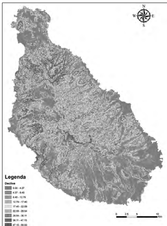
Fig 2. Carte de déclive de l'île de Santiago

Néanmoins, l'île de Santiago, comme partie intégrante du territoire national est considérée comme la première île agricole du pays, et à cet effet ne peut et ne doit pas rester en marge de ce cadre de développement économique, social et environnemental qui se veut imprégner du secteur agricole, d'où les efforts d'identification et la prévision pour l'introduction d'importants programmes et projets dans le cadre du Plan d' Action pour le Développement de l'Agriculture dans l'île de Santiago.