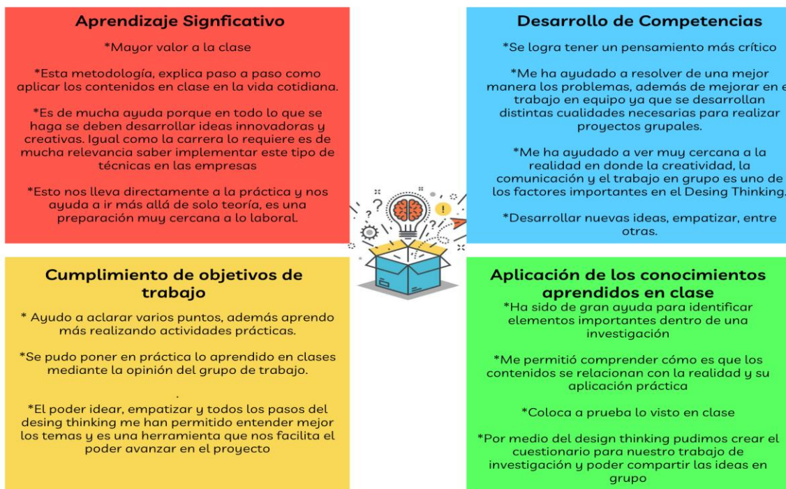
Figura 1. Categorías sobre la perspectiva en el uso de la herramienta Design Thinking

En el primer bloque sobre la aplicación propia del curso; a partir de la pregunta ¿cómo el uso de la herramienta le ha permitido aplicar el conocimiento del curso en clases?, se presentaron los siguientes resultados, los cuales fueron agrupados por categorías, al tratarse de una pregunta de respuesta abierta.