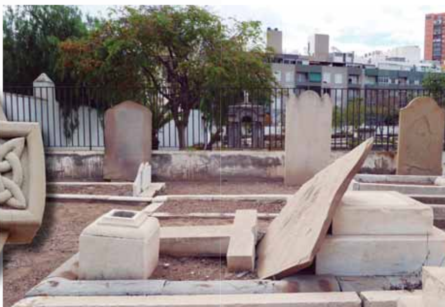
Cementerio inglés de Santa Cruz de Tenerife. Muchas sepulturas han sido destruidas por los actos vandálicos que, hasta hace unos años, se producían en el interior del recinto.

Hace unos años, un editor inteligente quiso pagarme en especies un trabajo: -Te mando de viaje donde elijas: Bali,