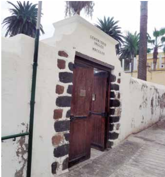
Entrada al recinto del cementerio inglés del Puerto de la Cruz, situado en pleno centro de la actual urbanización de esta localidad turística de la costa norte de Tenerife.