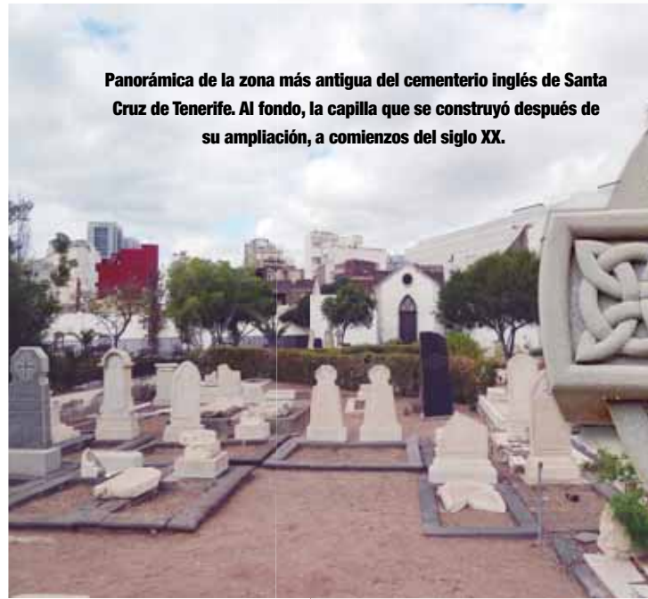
Panorámica de la zona más antigua del cementerio inglés de Santa Cruz de Tenerife. Al fondo, la capilla que se construyó después de su ampliación, a comienzos del siglo XX.