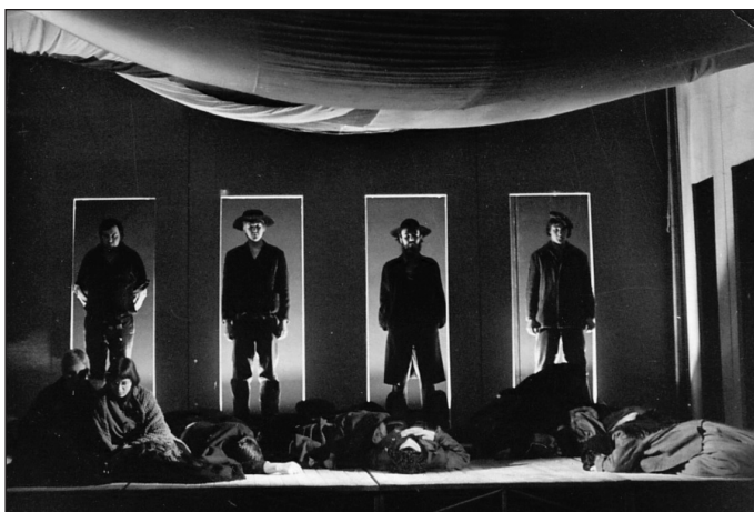
Los que van quedando en el camino , de Isidora Aguirre, por el grupo Cleta.