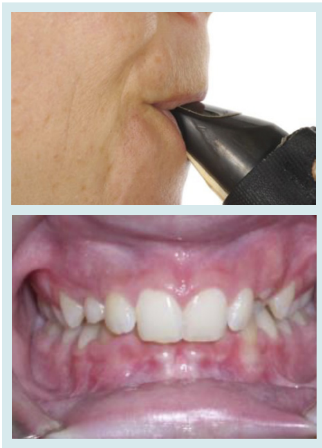
Figura 2. Embocadura simple en músico adulto mayor de clarinete. Maloclusión dental.

todos ellos sintomatología dolorosa a nivel de la ATM, dolor que se irradia a la boca y el cuello, así como lesiones en la mucosa labial, dependiendo del tipo de presión que se ejerza al interpretar una partitura. El 25% presenta retrognatismo en el aparato estomatognático y el 100% tiene desgastados los bordes incisales de los incisivos centrales inferiores y superiores.