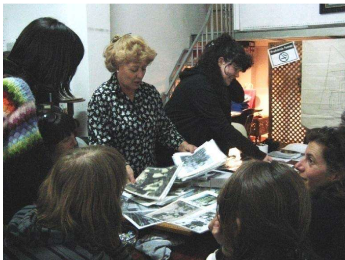
Foto 2 Primer día de la caminata del workshop SE-30 | otros paisajes: encuentro del grupo de caminantes con la Asociación de vecinos de la Barriada Jesús, María y José.