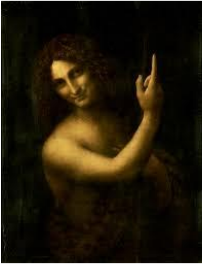
Ilustración 6. San Juan Bautista , Leonardo Da Vinci, 1513-16.