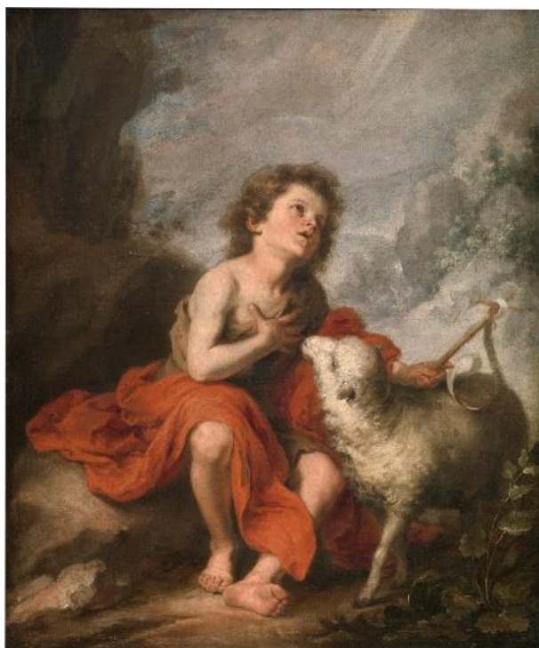
Ilustración 4. San Juan Bautista . Murillo. 1670.

suele ser uno de los símbolos de la Virgen, aunque en este caso, encontramos una rosa blanca, que nos representa la pureza, y el sufrimiento 31 . El otro ángel con las manos en posición de adoración sobre el pecho lleva su mirada a las otras figuras que finalizan la composición del cuadro. Figura también Santa Isabel (Elizabet) madre de San Juan Bautista, anciana como ya sabemos que era cuando consiguió ser madre. San Juan Bautista se encuentra con las manos enlazadas en posición orante, adorando al Niño Jesús. Esta composición está sucediendo en un interior, lo que le da ese toque familiar, más íntimo, la luz entra por la izquierda.