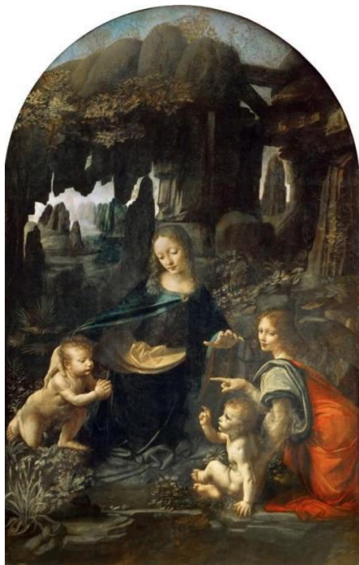
Ilustración 2. La Virgen de las Rocas . Leonardo Da Vinci. 1483.