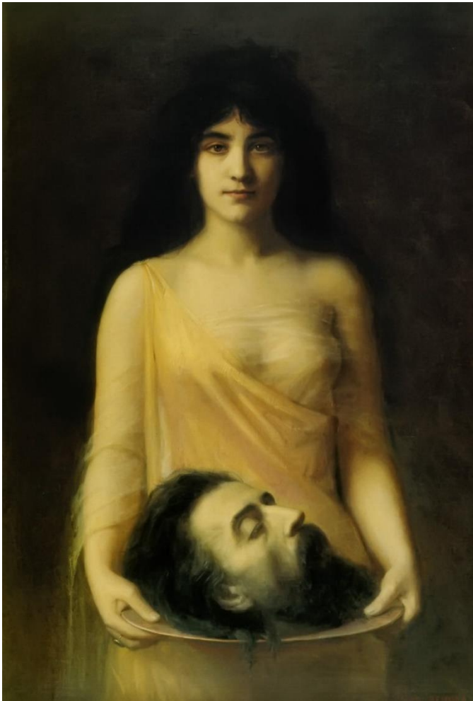
Ilustración 13. Salomé . Jean Benner. c.1899.