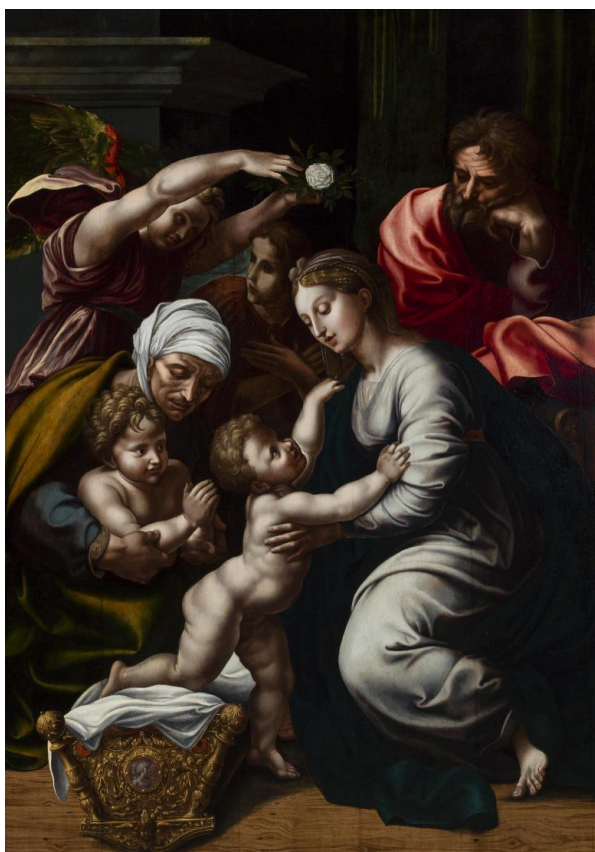
Ilustración 3. La Sagrada Familia con Santa Isabel, con San Juan Bautista Niño y dos ángeles . 1518. Recuperado del Museo de Bellas Artes de Bilbao.

miradas. ¿Qué está señalando y mirando cada figura? Hay diferentes versiones de este cuadro, con algunas diferencias entre ellas.