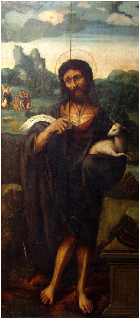
Ilustración 7. San Juan Bautista , Gumart de Amberes, c.1540.