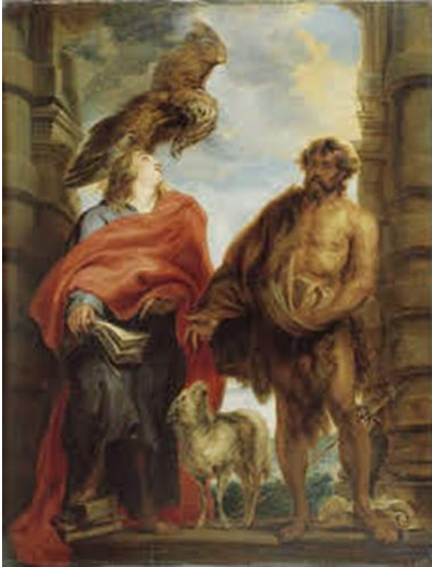
Ilustración 1. Los Santos Juanes . Anton Van Dyck, 1620.