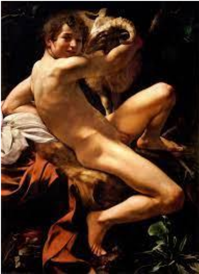
Ilustración 9. San Juan Bautista . Caravaggio. 1602.

esta obra con grandes cuernos, y está ladeando un poco la cabeza para observar a San Juan.