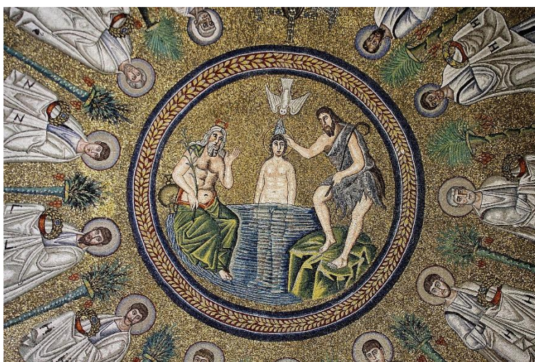
Ilustración 5. Baptisterio arriano de Rávena .