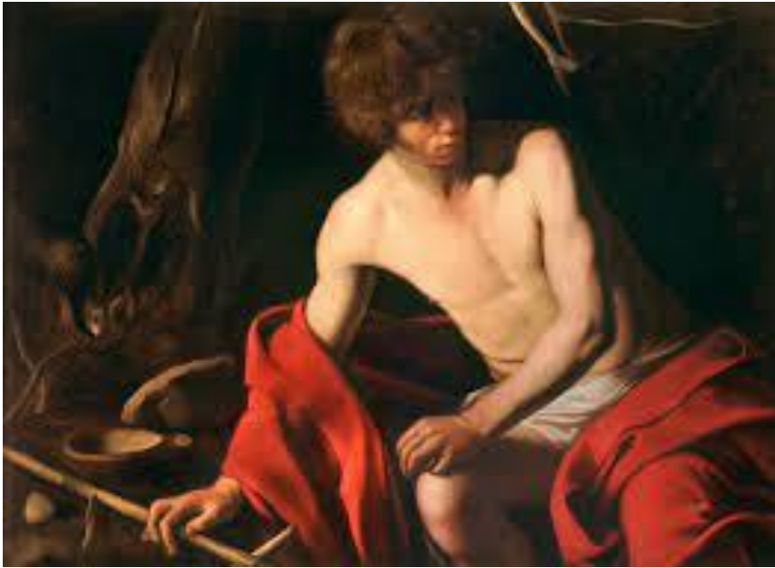
Ilustración 8. Juan el Bautista . Caravaggio. 1603.