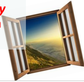
Imagen del correo institucional revistaelguiniguada@ulpgc.es